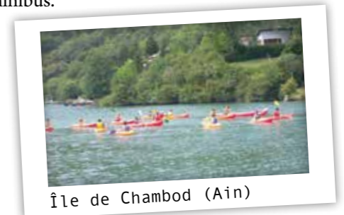
Île de Chambod (Ain)

Les enfants en mal de nouvelles sensations choisiront ce séjour conçu comme un tremplin "mégasport" : quad-trial, karting, baptême de parapente, trekking avec une nuit sous la tente, parcours accrobranche, tir à l'arc, canoë et voile, sans oublier, les soirées et les karaokés. ■