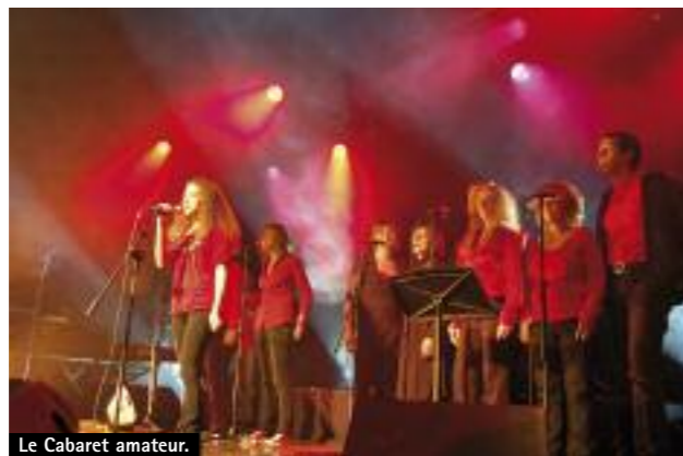
Le Cabaret amateur.