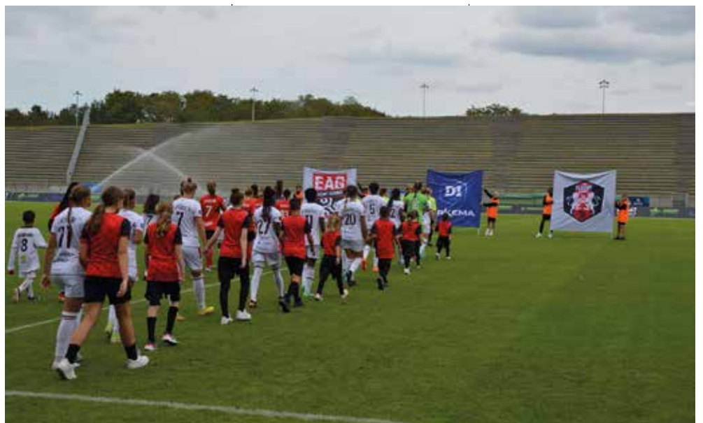
À chaque match, les enfants accompagnent les professionnelles sur le terrain.

« Ici, c'est Fleury ! » Malgré la délocalisation au stade bondoufflois pour les matchs de l'équipe pro, les supporters sont de plus en plus nombreux à venir encourager la dizaine d'in-