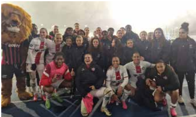
Ambiance de folie le 2 février contre le PSG.

RDV au stade Bobin pour des matchs de prestige contre Reims (le 2), Paris FC (le 22) et Lille (le 30), avec des animations pour tous. Et deux déplacements à Lyon, notamment pour la demi-finale de la Coupe de France (le 10).