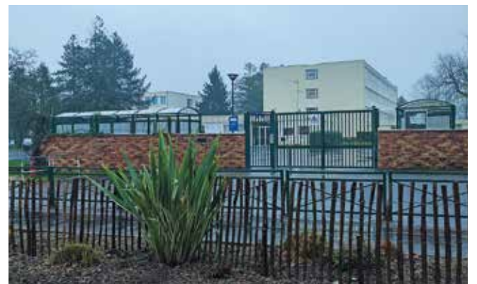
Le collège Paul-Éluard, parfois renommé "collège de Fleury"... mais plus pour longtemps !

En juillet 2020, le Conseil départemental a annoncé sa décision : les élèves aujourd'hui scolarisés entre le CE2 et la 6 e pourront se targuer d'être les premiers à fouler les couloirs de "leur" collège. À deux pas de chez eux. ■