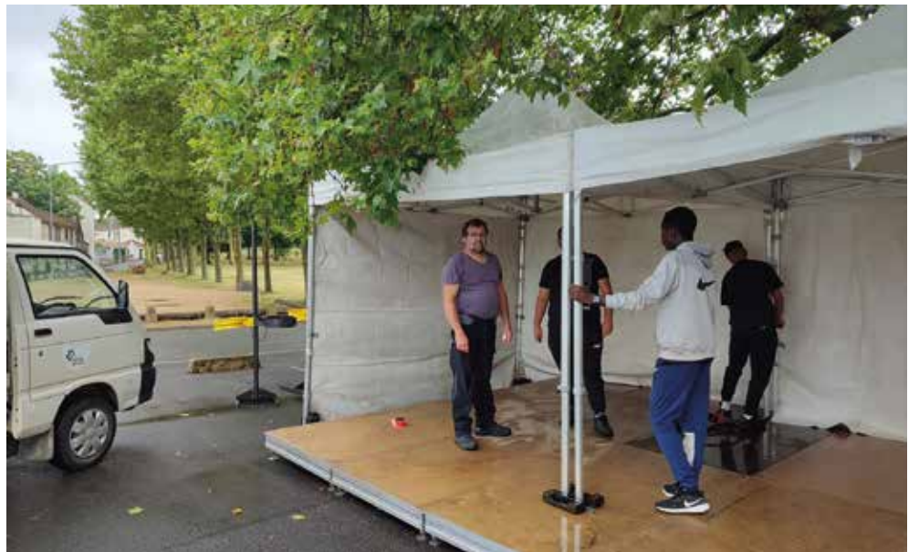
Une équipe soudée pour préparer les évènements municipaux, comme ici lors du village itinérant cet été.