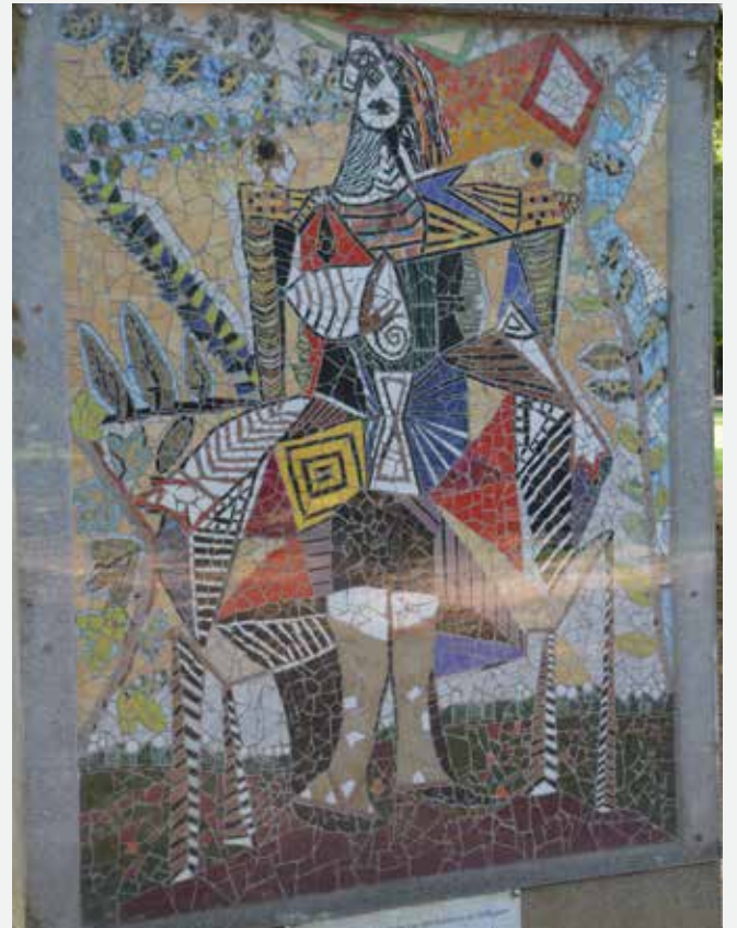
Mozaïque représentant le tableau Femme assise dans un jardin , visible à l'entrée du parc Pablo-Picasso de Morsang-sur-Orge.

1949, il offre une Colombe de la paix au Congrès mondial de la paix. « J'ai conscience d'avoir toujours lutté dans