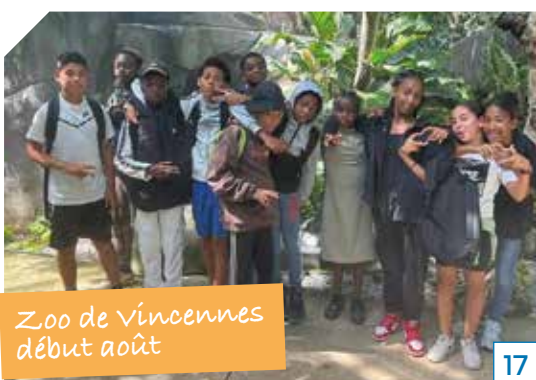
Zoo de Vincennes début août