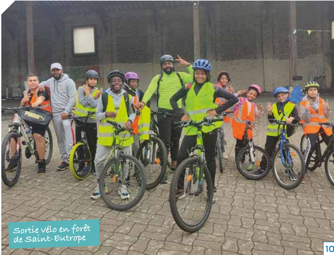
Sortie vélo en forêt de Saint-Eutrope