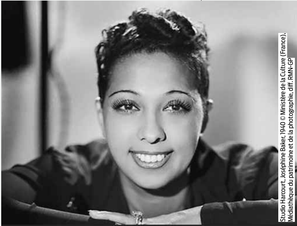
Studio Harcourt, Joséphine Baker, 1940 © Ministère de la Culture (France), Médiathèque du patrimoine et de la photographie, diff. RMN-GP

Ça y est, la nouvelle école de la rue Chagall a un nom. Joséphine Baker est arrivée en tête des votes des habitants et écoliers de CM1 et CM2. Rappelons que quatre femmes étaient en lice : Olga Bancic, Dulcie September, Rosa Bonheur et Joséphine Baker. Cette dernière a obtenu 40,54 % des voix. Mais qui est Joséphine Baker ? Retour sur le parcours de cette femme hors du commun.