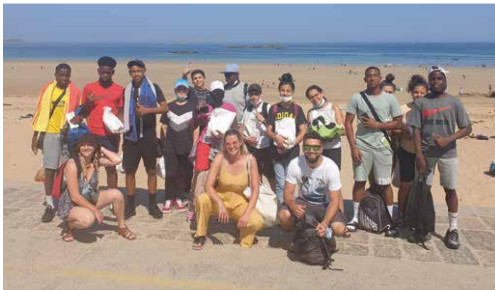
En 2021 un premier séjour entre jeunes de Fleury et Sainte-Geneviève avait été organisé.