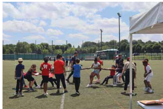
Initiation "olympique" pour les élèves de CE2 le 23 juin.

teur de l'école Desnos qui coordonne l'organisation. « Nous organisons cet apprentissage depuis quelques années. Les enfants découvrent une pratique avec d'autres habitudes motrices, une autre culture sportive avec ses valeurs, l'histoire du rugby. La collabora-