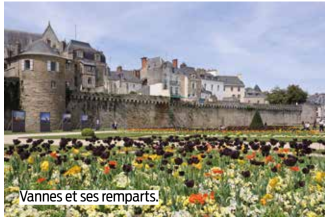
Vannes et ses remparts.

La Baule et sa baie, le parc naturel de Brière, Vannes et le golfe du Morbihan, la cité médiévale de Guérande et ses marais salants, le port du Croisic... seront au programme d'un séjour de 8 jours et 7 nuits, du 15 au 22 octobre au village club du Soleil (La Baule). Le tarif est de 410€.