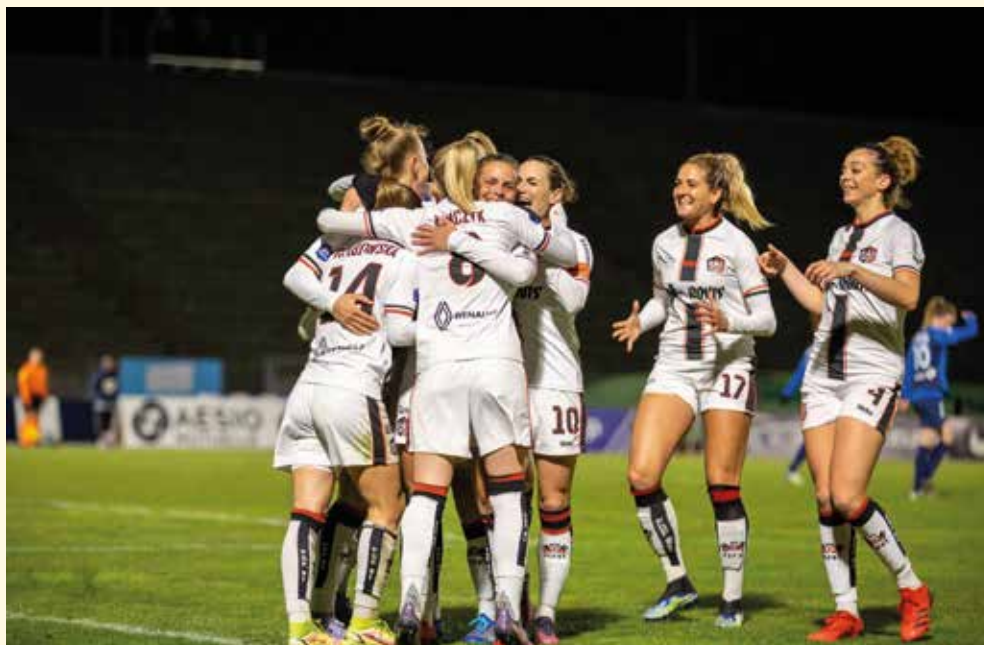
4 es de D1 Arkema, les filles du FCF 91 ont réalisé leur meilleure saison.