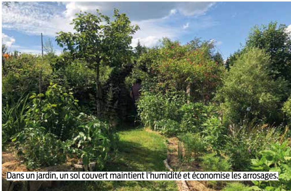
Dans un jardin, un sol couvert maintient l'humidité et économise les arrosages.

A dapter ses cultures est sans doute la première chose à faire pour avoir de belles récoltes d'été malgré le manque d'eau. Certaines plantes en effet résistent mieux que d'autres à la déshydratation. Choisissez des arbres dont les racines vont chercher l'eau loin dans le sol (figuier), des légumes résistants comme les carottes, panais, épinards vivaces... Veillez à l'emplacement de vos plantes : plein soleil pour vos aromatiques (thym, roma-