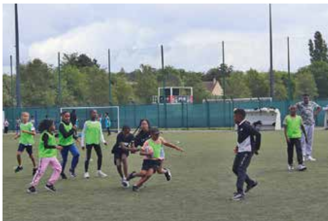
Le tournoi interclasses de rugby à 13 du 7 juin.

Cette fin d'année scolaire a été l'occasion, pour les écoles de la ville, d'organiser deux événements sportifs : tournois de rugby à 13 pour les CM1/CM2, et épreuves « olympiques » pour les CE2.